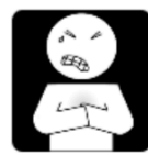
Pijn in de borst